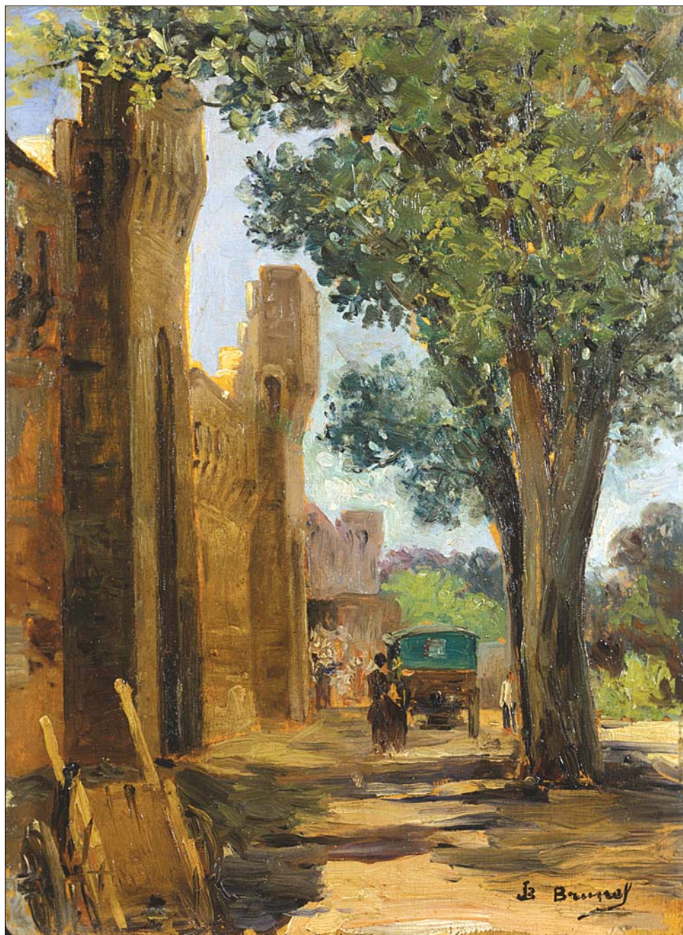
Au pied des Remparts ; huile sur bois, H : 0,35 m × L : 0,26 m. (coll. part.).