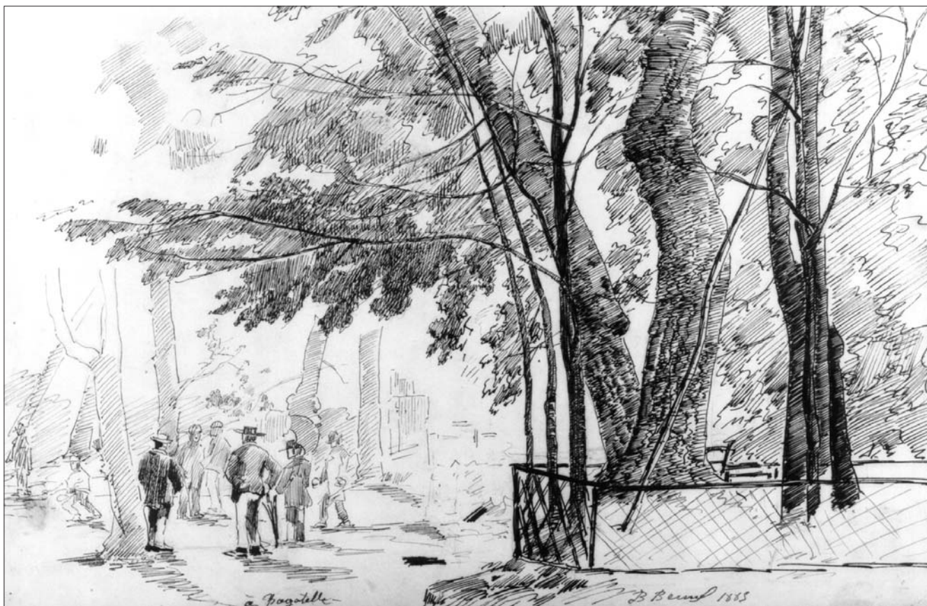
À Bagatelle, La Barthesse (1885) ; dessin à l'encre de Chine. H : 0,20 m × L : 0,30 m (coll. part.).