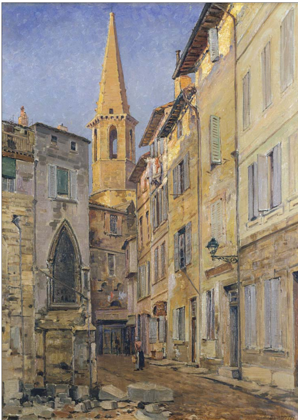
La Place de la Principale (1902) ; huile sur toile, H : 0,92 m × L : 0,68 m. (Mairie d'Avignon).