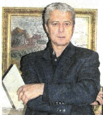
Raphaël Mérindol

Homme discret, Eugène Pascal quitta la mairie en 1866 pour devenir architecte-expert auprès de nombreuses compagnies d'assurances.